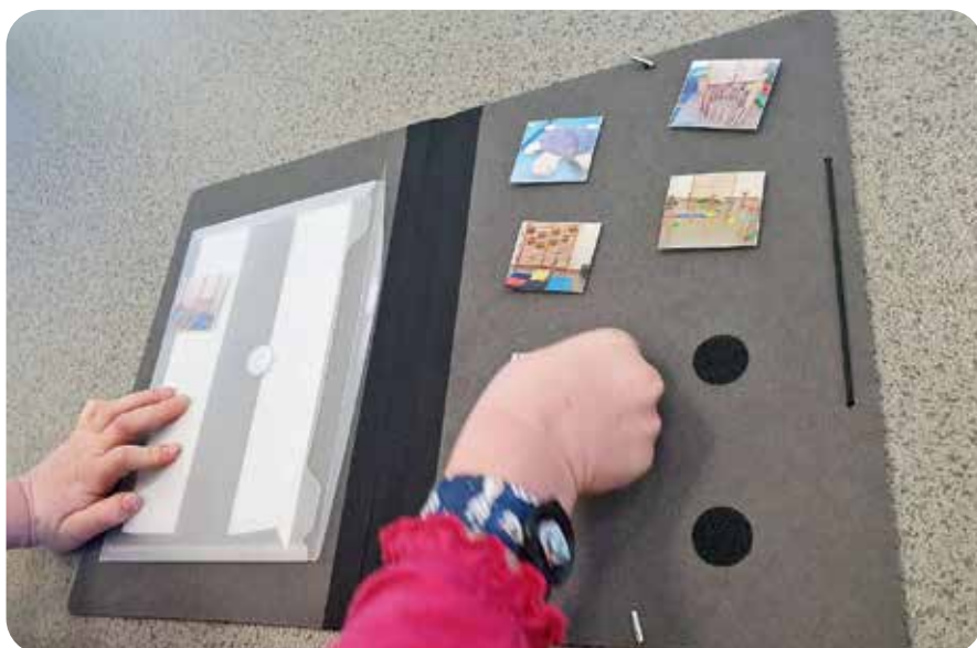
Abb. 5: Die Mappe als »Brücke« für ein partizipatives Vorgehen