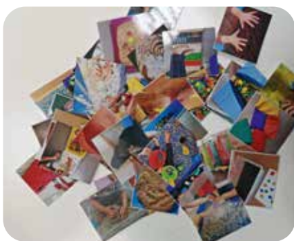
Abb. 2 und 3: Fotos von verschiedenen Materialien, Bewegungs- und Spielsituationen

Vor der Entwicklung der Fotos haben wir diese am Computer in Collagen eingebettet. Einlaminiert, auseinander geschnitten und mit einem Klettverschluss versehen, wurden die Fotos in beschriftete Umschläge einsortiert. Parallel dazu haben wir stabile Mappen gekauft, die auf der Innenseite rechts mit mehreren Klettverschlüssen (das Gegenstück zu den auf den Fotos) versehen wurden. Auf der linken Seite wurde ein Kunststoffumschlag in DIN A5 befestigt. Aufgrund der Größe des Teams haben wir die Fotos direkt dreimal abgezogen, um gleichzeitig mit den Mappen »Was machen wir heute?« arbeiten zu können.