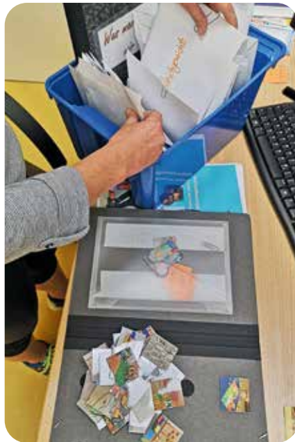
Abb. 4: Organisation der Bilder und Vorbereitung der individuellen Mappen

Mappe wurde aus den Briefumschlägen eine Vorauswahl von Fotos getroffen (Abb. 4). Die Fotos wurden entsprechend der Ressourcen und Interessen des Kindes, sowie den Teilhabezielen ausgewählt und in den großen Umschlag auf der Innenseite der Mappe gelegt.